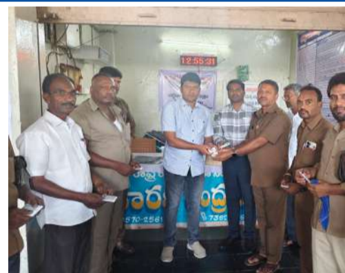
భావాన్ని పెంపొందించుకోవాలని సూచించారు. ముఖ్యంగా వృద్ధులు, దివ్యాంగుల పట్ల సహానుభూతితో వ్యవహరించాలని సూచించారు.

కుప్పం, చిత్తూరు ఎక్స్ ప్రెస్, ఏప్రిల్ 08: పెరుగుతున్న వేసవి ఉష్ణోగ్రతల నేపథ్యంలో సిబ్బంది ఆరోగ్యాన్ని కాపాడేందుకు కుప్పం ఆర్టీసీ డిపో అధ్యక్షులు ప్రత్యేక చర్యలు చేపట్టారు. బుధవారం స్టాండ్ బస్ స్టేషన్ ఆవరణలో నిర్వహించిన కార్యక్రమంలో క్షేత్రస్థాయి సిబ్బందికి దాహ నివారణ ద్రావణపు పొట్టాలను పంపిణీ చేశారు.