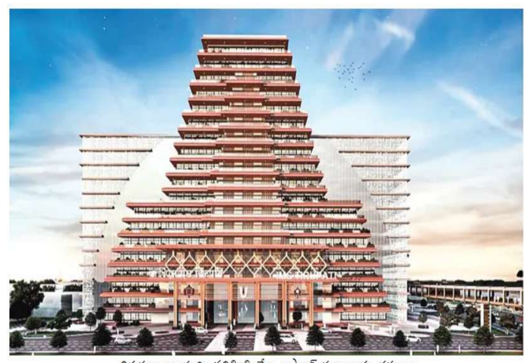
తిరుమల ఆలయాన్ని ప్రతిబింబించేలా బస్ స్టాండ్ ముఖద్వారం నమూనా

చేయనున్నారు.99 సెంటు భూమిని రోడ్డు కోసం, 79 సెంటు భూమిని ఓ ఓవర్ కోసం నిర్మించనున్నారు. బస్ టెర్మినల్ లో పార్కింగ్ కోసం సెలార్ లో రెండు అంతస్తులు ప్లాన్ చేశారు. ఇలా ఆయ నదుపాయల కోసం భూమిని కేటాయించారు. ప్రస్తుత ప్లాన్ ప్రకారం గ్రౌండ్ ఫ్లోర్ మొత్తం టెర్మినల్ కు కేటాయించారు. మొత్తం 98 ఫ్లోర్ ఫ్యామ్ నిర్మాణం.. టెర్మినల్ ప్రాంగణంలో మరో 50 బస్సులు నిలిపేందుకు వీలుగా స్థలం కేటాయించనున్నారు. టెర్మినల్ గ్రౌండ్ ఫ్లోర్ పై 10 అంతస్తులు నిర్మించి కమర్షియల్ (హోటళ్లు, రెస్టారెంట్లు, డార్బరీలకు, మిగిలిన షాపులకు) కేటాయించారు. అంతేకాదు టెర్మినల్ లోని పడే ఫ్లోర్ లో హెలిపాడ్ నిర్మించాలని