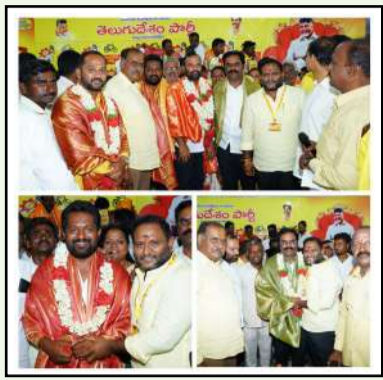
శాంతిపూర్, చిత్తూరు ఎక్స్ ప్రెస్,