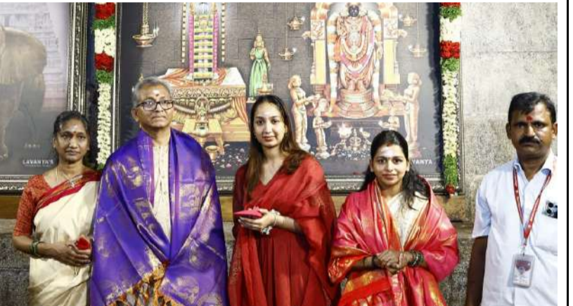
శ్రీకాళహస్తి, చిత్తూరు ఎక్స్ ప్రెస్, ఏప్రిల్ 13: