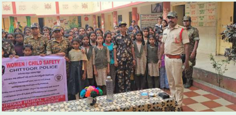
శాంతిపురం, చిత్తూరు ఎక్స్ ప్రెస్, ఏప్రిల్ 13: