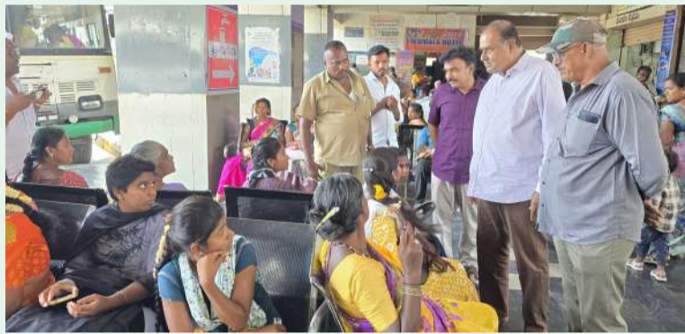
కుప్పం, చిత్తూరు ఎక్స్ ప్రెస్, ఏప్రిల్ 13

ప్రయాణికుల సౌకర్యాలపై ప్రత్యేక దృష్టి.. ఏపీఎస్ఆర్టీసీ వైస్ చైర్మన్