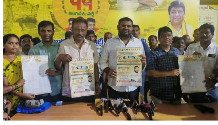
శ్రీకాళహస్తి, చిత్తూరు ఎక్స్ ప్రెస్, ఏప్రిల్ 13: