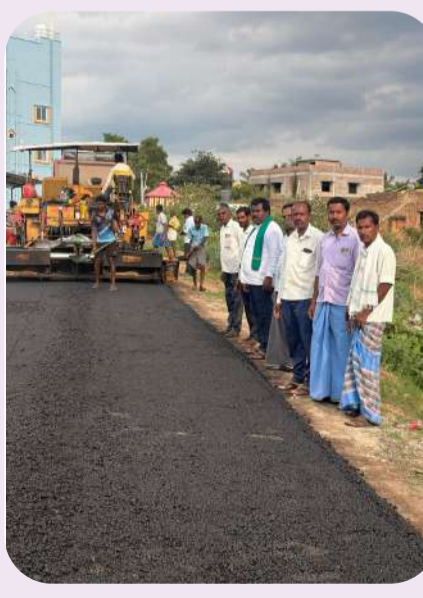
కుప్పం, చిత్తూరు ఎక్స్ ప్రెస్, జూన్ 13: