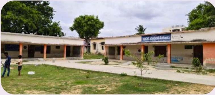
కుప్పం, చిత్తూరు ఎక్స్ ప్రెస్, జూన్ 13:

స్థలం సిద్ధంగా ఉంది..భవనం నిర్మిస్తే చాలని స్థానికుల విజ్ఞప్తి