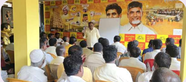
శాంతిపురం, చిత్తూరు ఎక్స్ ప్రెస్, జూన్ 13: