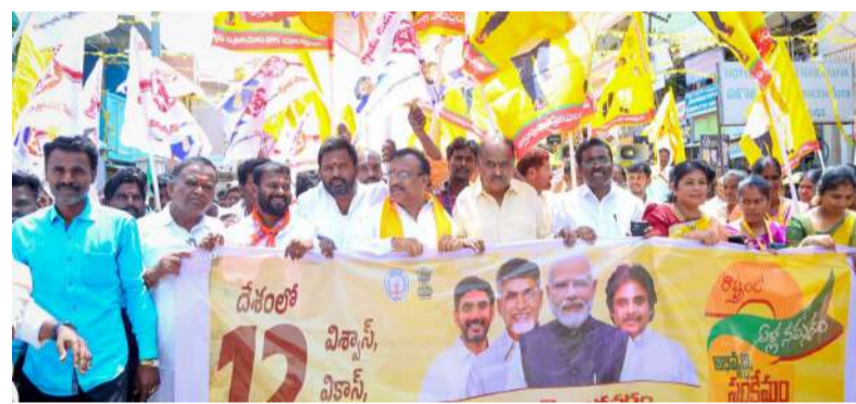
కుప్పం, చిత్తూరు ఎక్స్ ప్రెస్, జూన్ 17:

కూటమి ప్రభుత్వం రెండేళ్ల పాలన పూర్తి చేసుకున్న సందర్భంగా "నమ్మకం -- అభివృద్ధి -- సంక్షేమం" పేరుతో చిత్తూరు జిల్లా కుప్పం నియోజకవర్గ స్థాయి సమావేశం ఘనంగా నిర్వహించారు. సమావేశానికి ముందు కుప్పంలోని తిరుపతి గంగమ్మ దేవాలయంలో ఎన్డీఏ నాయకులు ప్రత్యేక పూజలు నిర్వహించారు. అనంతరం రాత్రిగా సభా ప్రాంగణానికి చేరుకుని సమావేశాన్ని ప్రారంభించారు. ఈ సందర్భంగా రాష్ట్ర ప్రభుత్వం గత రెండేళ్లలో అమలు చేసిన అభివృద్ధి, సంక్షేమ కార్యక్రమాలు, ప్రజలకు అందించిన సేవలపై విస్తృతంగా చర్చించారు. ముఖ్యమంత్రి నారా చంద్రబాబు నాయుడు నాయకత్వంలో కుప్పం నియోజకవర్గం అభివృద్ధి పథంలో వేగంగా ముందుకు సాగుతుందని నాయకులు పేర్కొన్నారు. రహదారుల అభివృద్ధి, తాగునీటి సదుపాయాల మెరుగుదల, వ్యవసాయ రంగానికి ప్రోత్సాహం, విద్యా, వైద్య రంగాల బలోపేతం, గ్రామీణ మౌలిక వసతుల విస్తరణ వంటి అనేక అభివృద్ధి కార్యక్రమాలు వేగంగా అమలువుతున్నాయని తెలిపారు. ప్రజల ఆకాంక్షలకు అనుగుణంగా కుప్పంను ఆదర్శ నియోజకవర్గంగా తీర్చిదిద్దేందుకు ప్రత్యేక చర్యలు చేపట్టినట్లు వివరించారు. కుప్పం అభివృద్ధి కోసం వేల కోట్ల రూపాయలు విలువైన పనులు మంజూరి వివిధ దశల్లో అమలువుతున్నాయని పేర్కొన్నారు. రాష్ట్ర ప్రజలు కూటమి ప్రభుత్వంపై ఉంచిన విశ్వాసాన్ని నిలబెట్టుకుంటూ అభివృద్ధి, సంక్షేమాన్ని సమానంగా ముందుకు తీసుకెళ్లడమే ప్రభుత్వ లక్ష్యమని తెలిపారు. కుప్పం నియోజకవర్గాన్ని మరింత అభివృద్ధి పథంలో నడిపించేందుకు పార్టీ శ్రేణులు, ప్రజాప్రతినిధులు, అధికారులు సమన్వయంతో పనిచేయాలని పిలుపునిచ్చారు. సమావేశంలో ఎన్డీఏ నాయకులు, ప్రజాప్రతినిధులు, పార్టీ కార్యకర్తలు, పెద్ద సలఖల్లో ప్రజలు పాల్గొన్నారు.