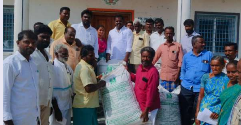
కుప్పం, చిత్తూరు ఎక్స్ ప్రెస్, జూన్ 17: