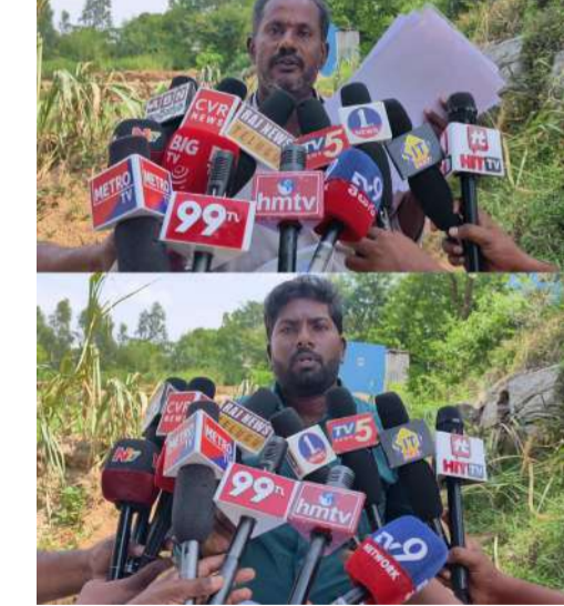
గుడుపల్లి, చిత్తూరు ఎక్స్ ప్రెస్, జూన్ 17: