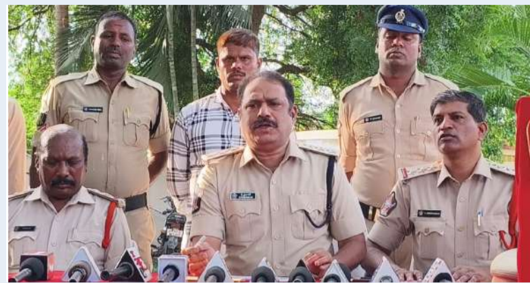
చిత్తూరు, చిత్తూరు ఎక్స్ ప్రెస్, జూన్ 19: